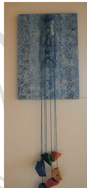
Totem natura (59.5x109.5)